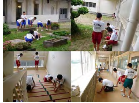
三中！掃除合戦！の様子

6月20日（木）の生徒総会で「三中！掃除合戦！」を行うことが決まり、7月5日（金）に実施しました。今回は、三中では初めての専門委員会ごとの掃除となり、同じ場所を1年生から3年生までの縦割りのグループで掃除しました。最初はどううまくいかどうか少し心配していましたが、どの生徒も一生懸命最後まで、自分の担当場所で責任をもって頑張りました。特に上級生は下級生と一緒に、いつも以上に張り切って頑張っていたように思います。これからも普段の掃除でもこの経験を活かして頑張ってもらいたいと思います。