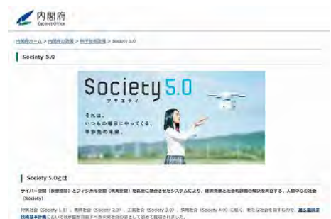
Society5.0 広報の内閣府ホームページ