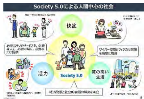
Society5.0 による人間中心の社会