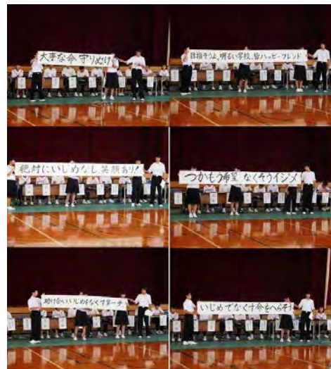
各学級の「いじめ0宣言」