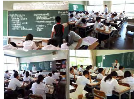
「いじめ」に係る道徳授業

今回の生徒総会では、たくさんの議題がありましたが、生徒全員198人で新時代の第三中学校を築き上げるための第1歩になったと思います。