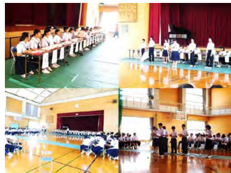
生徒総会当日の様子